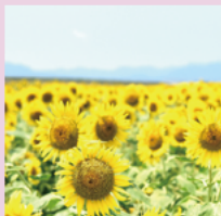
花の海 ひまわり畑

山陽小野田市は、山口県南部に位置し、瀬戸内海に面した温暖な気候で、優れた自然環境、おでかけしやすい良好なアクセスを備えています。「スマイルシティ山陽小野田」で、あなたの笑顔、探しに来ませんか？