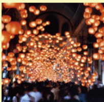
山口七夕ちょうちんまつり

山口市は、山口県のほぼ中央部に位置する豊かな自然や歴史が共存する文化都市です。海・山・街がちょうどいいのんびりと便利が同居するまち山口市で、自身のライフスタイルに合わせた暮らしを選択してみませんか？